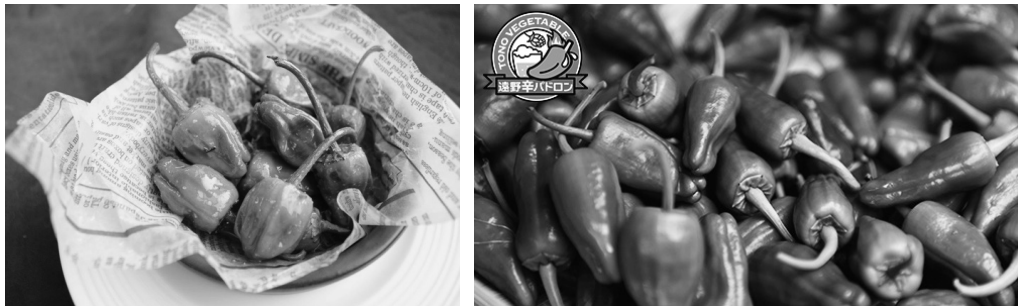
図表 1-3 パドロン