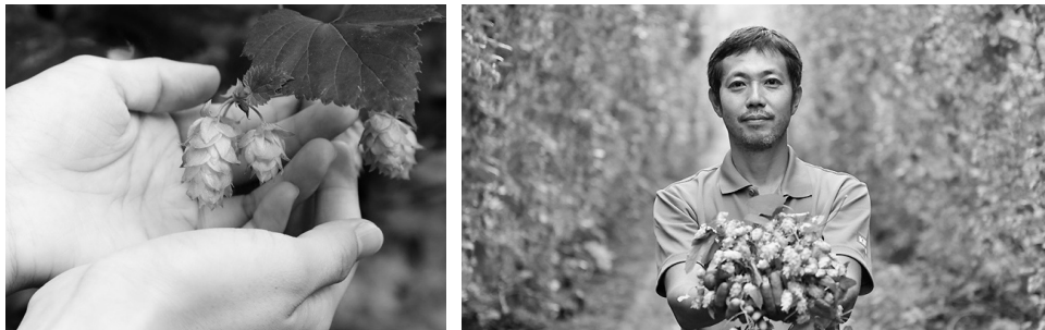
図表 1-4 ホップ