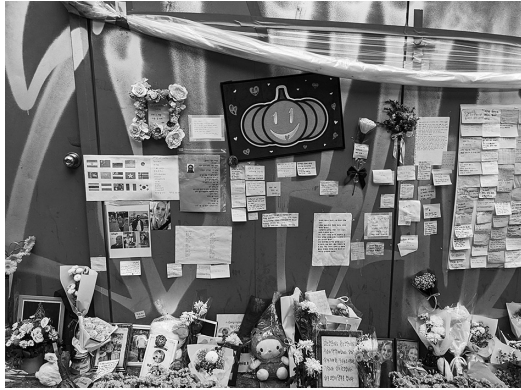
写真7 外国人のメッセージ