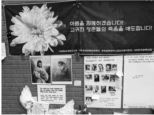
写真5 キリスト教関係のメッセージ

最初に、羅貞一副所長から、事故の概要や政府の対応について現状報告があった。これほど大きな規模の災難は、2014年のセウォル号惨事以来であり、犠牲者の層もセウォル号惨事と重なっており、セウォル号惨事を想起させ、社会的衝撃は大きい。また、国の対応としては、哀悼期間を設け、梨泰院を特別災難地域に指定し、亡くなった方に約200万円、葬儀費用に約150万円を支援しているが、これには国内にも賛否がある。遺族や負傷者、現場にいた者だけでなく、SNSで動画が拡散され、それを見た者たちが、精神的苦痛を訴えており、ソウル市でも無料で心理支援の施設を設けており、国も全国民が心理支援を受けられるようにしていると報告があった。