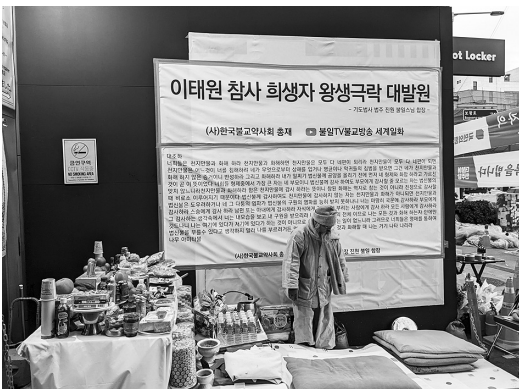
写真3 仏式の祭壇と僧侶