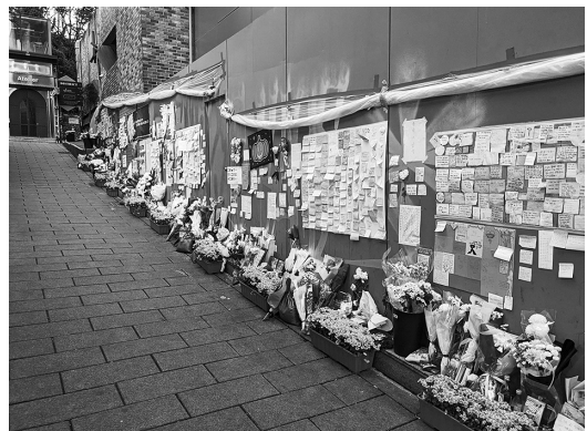
写真4 ホテル側の壁

ないほど、とても狭い路地であることがわかる(写真2)。入口付近には、付箋紙とペンが用意されており、訪れた者がメッセージを書きことができる。入口の右側には、仏式の祭壇が設置されており、果物や菓子、飲料水などが供えられている。仏僧が一人、冬空の寒い中、屋外にもかかわらず、祭壇を守っている(写真3)。年配の女性が一人、付近の道路の掃除をしたり、メッセージの紙やお供えの世話をしていた。路地入口の左側は商店が連なっており、入口の右側、つまりハミルトンホテル側の壁も、メッセージが書かれた紙や写真でびしりと埋め尽くされており、花束や鉢植えの花が壁に沿って供えられている(写真4)。キリスト教関係の団体も壁にメッセージを書いた横断幕を張っている。その周辺にはキリスト教関係者のメッセージやお供えが集まっているようだ(写真5)。路地の反対側の入口から見ると、大きな通りに向かって、けっこう急な下り坂に