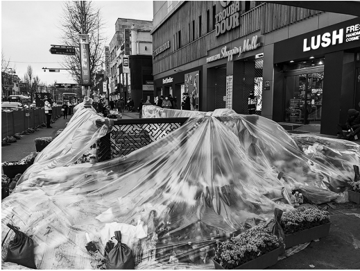
写真1 梨泰院駅1番出口