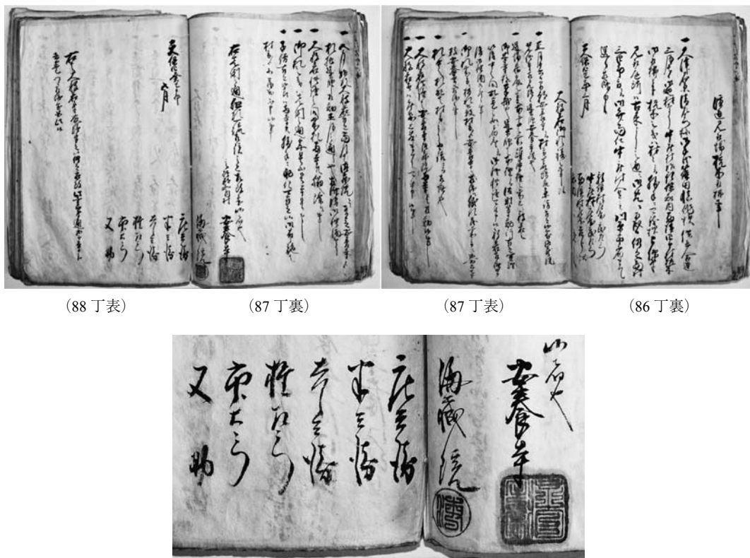
【図3】知内村「記録」天保4年(1833)部分(上)、押印部分拡大(下)

そこで問題となるのは、なぜ「記録」に写された規約書に2ヶ寺のみ押印がなされているのかということである。本来、2ヶ寺と村側で互いに内