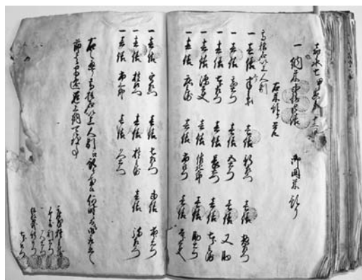
【図4】知内村「記録」嘉永7年（1854）「御囲米預覚書」

知内区有文書には同様の史料は見いだせず、おそらく「記録」上でのみ作成された文書ということになるか。ここでは、村の囲米が個人へと預けられることの記録であるとともに、算用帳簿としての機能が込められていると判断できよう。ただし、その後、「記録」にみえる安政5年（1858）、万延元年（1860）、文久元年（1861）の「囲米預人別書」には、5人の押印も確認印もない。この嘉永7年の「御囲米預覚書」の押印は、単なる偶発的なものであろうか。おそらく、それ以降において押印は必要ないが、内容は保証されたと考えた方が妥当と思われる。