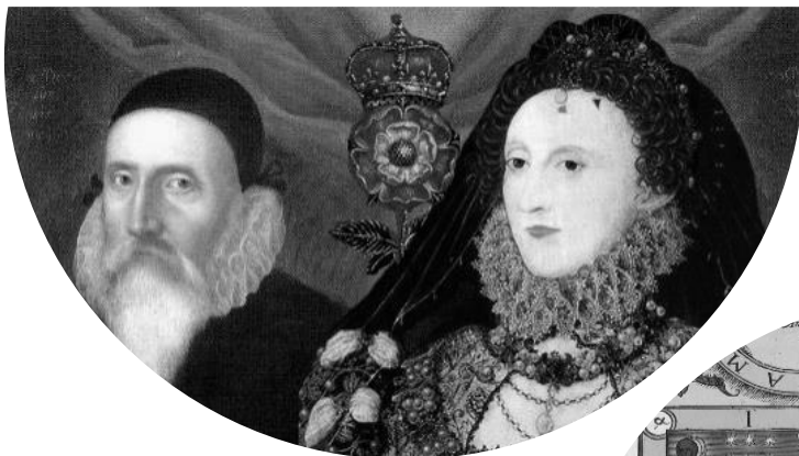
John Dee & Elizabeth I