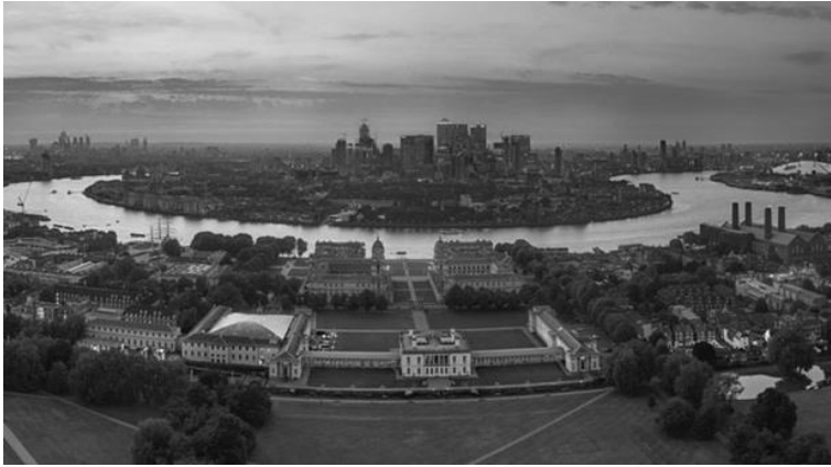
Her Birthplace Greenwich