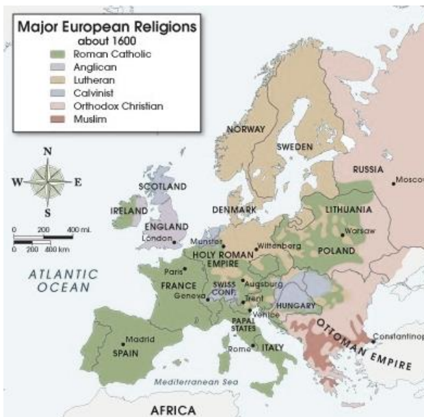
Catholic and Protestants at Europe in 1600