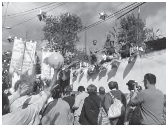
写真2 祭礼当日の行列の様子（塀の上に子供が見える）