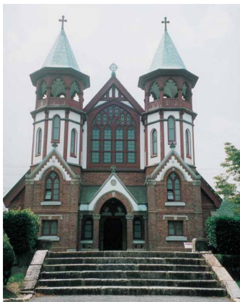
明治村の聖ヨハネ教会