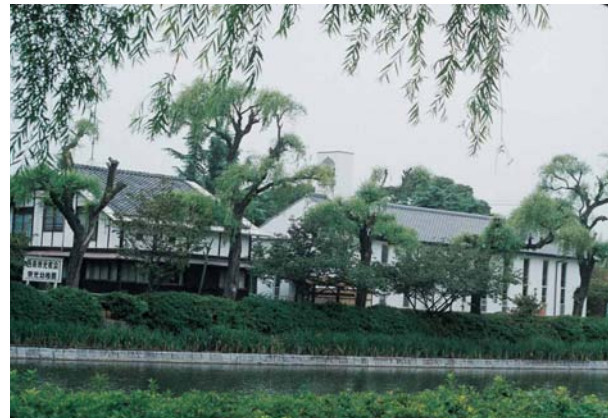
日本基督教団西条栄光教会