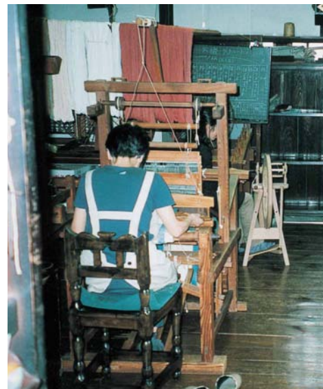
倉敷民芸館付属工芸研究所 (後に倉敷本染手織研究所と改称)

縄民芸の調査、指導、蒐集に努力している。外村にとって、沖縄の民芸は特別な意義をもっているが、その最初の出会いは、1939年3月、柳宗悦をはじめ日本民芸協会の同人と共に沖縄を訪問し、約二ヶ月間滞在したことに遡る。その滞在において、沖縄の工芸に学び、その保存と発展の助力をするために、柳宗悦が全体を統率し、陶工の浜田庄司と河井寛次郎は壺屋の窯場で、染工の芹沢銈介と岡村吉右衛門は首里の瀬名波や那覇の知念染場で、織工の外村吉之介と柳悦孝は首里内外の織女たちの許に、田中俊雄は図書館に通って、それぞれ調査と研鑽に励んでいる。外村自身が、沖縄滞在中を通して何を考え何を学んだかについては、その執筆担当した「日本民芸協会同人 琉球日記」、『工芸』の琉球特集における「琉球の民芸」、「琉球の織物について」、また『月刊民芸』の琉球特集における「琉球の近道」、「琉球の芝居」、「久米島だより」、「琉球の友へ」などの随想で窺い知ることができる (13) 。