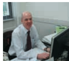
関学自治体NPMセンター で Stuart Russell 氏