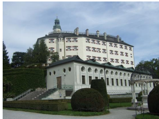
図10 Schloss Ambrace (Innsbruck)