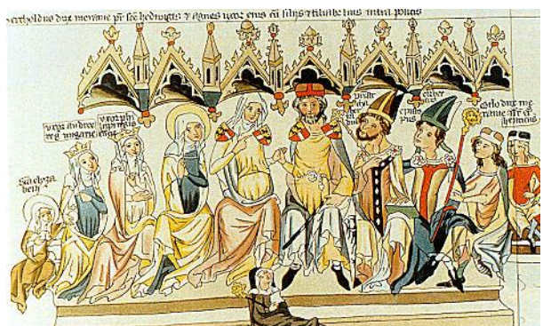
図4 Haus Andechs-Meranien (Herzog)