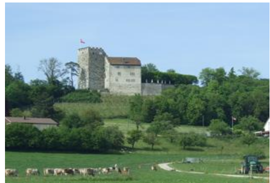
図2 Schloss Habsburg