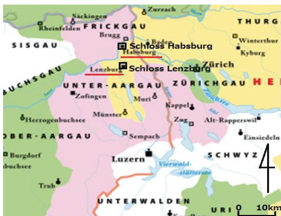
図1 Habsburg-Lenzburg in Swiss:筆者編集

国家や民族、言語、文化が錯綜し、戦争の絶えなかったヨーロッパにおいて、新たな理想を掲げたアンデクス・メラン家が断絶後、ハプスブルク家に託したその精神と統治が今日に継承されていることに及びたい。