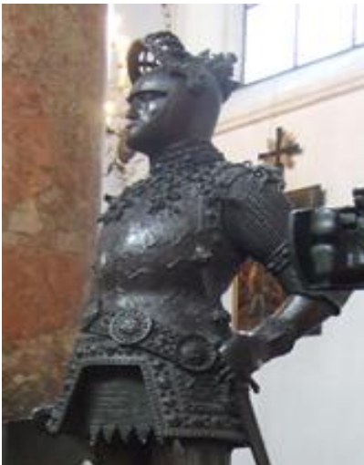
図8 King Arthur, Hofkirche(Innsbruck)