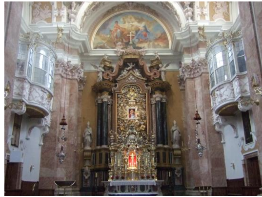
図9 Innsbrucker Dom