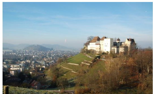
図3 Schloss Lenzburg