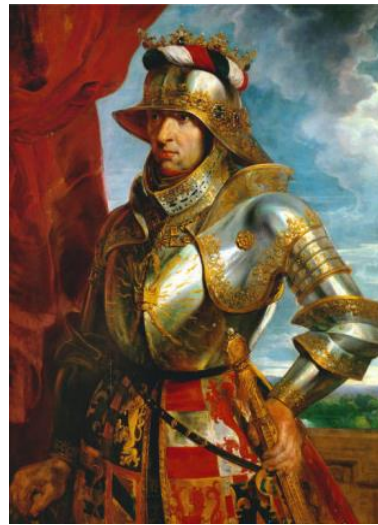
図11 Der letzte Ritter, Maximilian I. (HRR. 1459-1519)