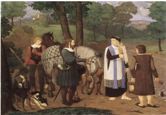
図7 Rudolf und der Priester (Gemälde von Franz Pforr um 1809)