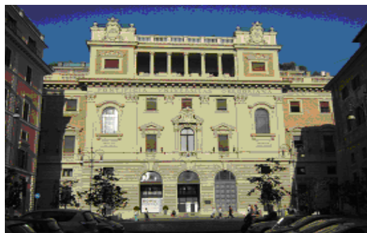
図4 ローマ教皇庁立グレゴリアン大学(同)

や人文社会科学をも修得し、総合的かつ全人的な教育を重視するロヨラの姿勢が明確に示されていた。