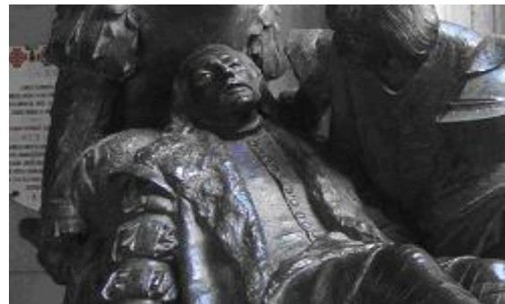
図 2 瀕死のロヨラ像（ロヨラ城、同）

ロヨラは少年時代、スペイン・バスク地方の貴族（騎士）として父の城の中で過ごし、カトリック信仰とともに聖杯騎士伝説の世界に憧れ、恋愛そして騎士としての武勲を夢見ており、ロヨラは当初、信仰よりも世俗的な成功を求めていることが自伝から窺える。しかし、フランス軍の侵攻にともなうパンプローナでの籠城戦で足に重傷を負い、死線をさまようことになる。（ 図 2 ）