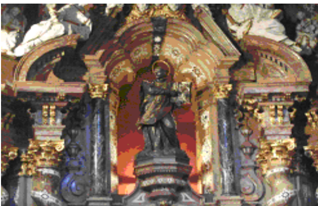
図 1 ロヨラ像（スペイン・ロヨラ城教会）

16 世紀における対抗宗教改革の先鋒を担ったイエズス会（1534）を創設し、カトリックを再興した「神の騎士」イグナチオ・ロヨラ（1491-1556、 図 1 ）は、イエズス会士を日本に派遣するなど、キリスト教を世界に布教した人物としても知られる。ローマ・カトリックの守護者としてのロヨラに関する研究はすでに完成の域に達しているかにみえる。しかしながら、「神に導かれた」という神学的形容に包まれたロヨラの生涯が学術的アプローチやリアリズムの視点から遠ざけられている感も否めず、当時のカトリックがいかに再興されたかといった核心部分が問われてはいなかった。私は、ロヨラがその生涯の中で得た精神性こそがイエズス会そしてカトリック改革に大きな影響を与えており、これがキリスト教義にはない聖杯騎士伝説の中にあつたとみている。この伝説はロヨラの歩んだ道程やイエズス会の布教ルートにも影響を及ぼしている上、彼の右腕であったフランシスコ・ザビエル（1506-1552）と信仰以外にも多くの共通点を有している。