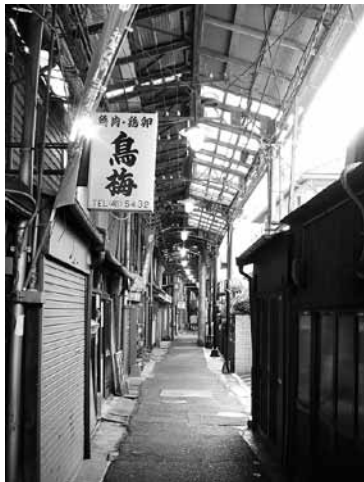
写真 12 出屋敷商店街

尼崎センタープール前駅から阪神電車を出屋敷駅に向かう。ここから今回のエクスカージョンのサブである尼崎市中心部の徒歩巡検、特に「寺町巡検」を開始する。主目的は近世期に整備されて