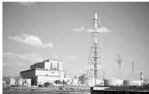
写真6 尼崎第三発電所（1998年頃、筆者撮影）

ゼロメートル地帯であり、尼崎港内の水位は大阪最低潮位線（O.P.）よりも低い。よって大規模な排水ポンプによって河川水を排水するとともに、大阪湾の海水が入りこまないようにあらゆる水域が仕切られている。尼崎港と大阪湾を結ぶ唯一の出入り口がこの尼崎閘門なのである。この閘門は2枚の扉を持っている。1枚目の扉が開くとともに船舶は閘門内に入り、1枚目の扉を閉鎖した上で2枚目の扉を開く。この作業によって尼崎港内と大阪湾の間における水の出入りを最小限にとどめながら、船舶を通行させることができる。今回は我々のボートとともに先の大型バージも同時に閘門内に入って来たため（写真3）、一同さらに盛り上がる。前扉が閉められ、後扉が開かれると、閘門内に大阪湾の水が流れ込んできた（写真4）。