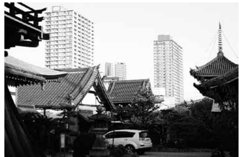
写真14 寺町とタワーマンション