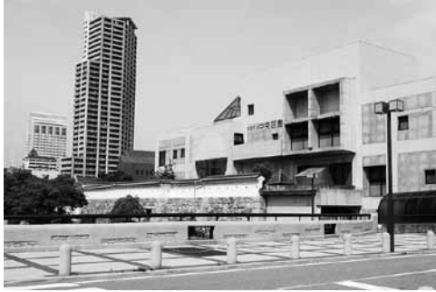
写真 15 ニ崎城趾にて

威容が確認できる（写真 15）。それらを見ながら 17 時 30 分頃に阪神尼崎駅（11）に到着し、ここで解散した。なお、希望者とともに中央商店街巡りをさらに続けておこなった。