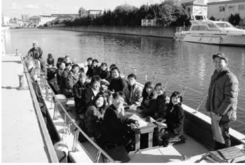
写真1 兵庫県尼崎港管理事務局での出港風景