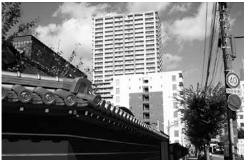
写真13 寺町横のマンションとタワーマンション

なお、寺町の景観について改めて問うのであれば、この9階建てのマンションより以上に目に付くものがある。それは背後にある超高層(タワー)マンションである(写真13)。寺町の真北には「さきタワー・サンクタス尼崎駅前」(2008年竣工、29階、103m)が立地する。同タワーも含めてこの界限には3棟のタワーマンションがあり、いずれも寺町から確認できる(写真14)。特に「阪神尼崎駅南地区第一種市街地再開発事業(組合施行)」として計画され、2010年に竣工した「ローレルタワー尼崎」(29階、99m)の場合、全体事業費約90億円のうち、市負担額は約8億円となっている。他方で尼崎都市美形成条例に関する事業費はこの10年で大幅に減額され、寺町などの景観保全に用いられるべき補助金は2004年度にゼロになり、そのまま推移している。尼崎市の財政再建プログラムの一環として決定された「都市美形成助成事業の休止」の影響によるものである(尼崎市、2003)。補助金がゼロになったのとマンション景観問題が生じたのが同じ2004年の出来事であったのは単なる偶然のはずである。しかし社会的・経済的状況の変化によって尼崎市の景観行政や町