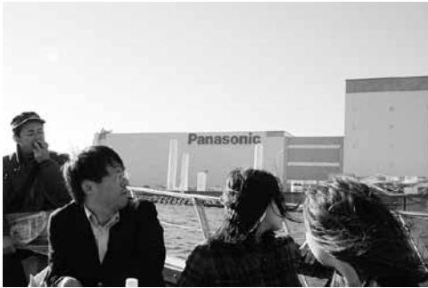
写真7 パナソニックプラズマディスプレイ工場