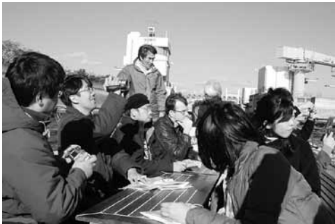
写真5 尼崎閘門から大阪湾へ