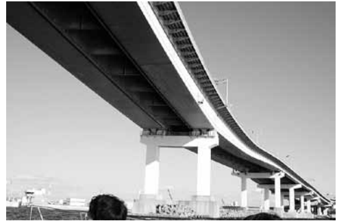
写真8 阪神高速湾岸線