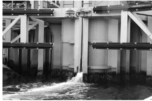
写真4 後扉（大阪湾側）の開門