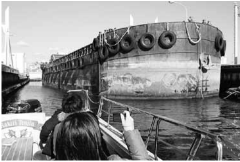
写真3 尼崎閘門にて