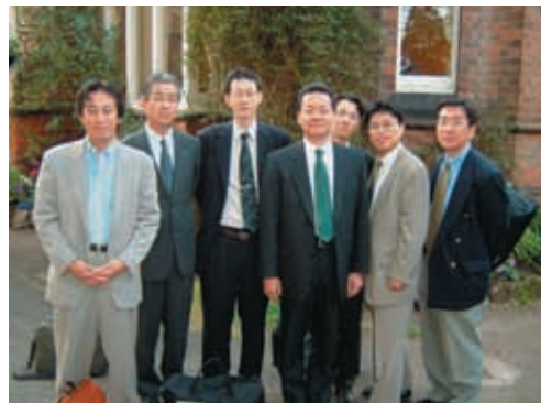
写真9 2003年7月フォーラムKGP M創設にかかわった主要メンバーによるイギリス自治体の行政視察にて 写真左は、村尾信尚氏(NEWS ZEROキャスター)