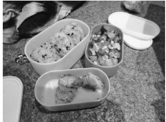
写真1 Oさんのお弁当

相談室で用いられるもうひとつの技術は、食物日誌である。相談室では、病院で受ける血液検査や皮膚検査の結果も参考にしうえて、母親本人がよく「観察する」ことを重視した指導を行っており、そこで用いられるのが、食物日誌である。食物日誌は、見開きで、一週間分の食事（食材）