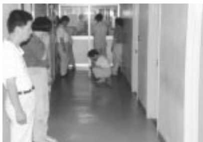
図 4 廊下での行列の様子（整備前）