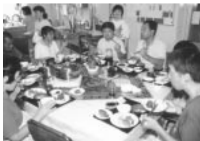
図 3 時間差の給食の様子（整備後）