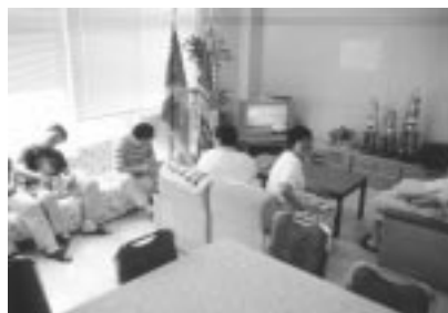
図 5 娯楽室兼待合室の様子（整備後）

に入る時間が分散し、食堂が今まで以上に混雑することはなかった。時間差で食事をしているために、食後の食器返却場所での混雑が無くなり、食堂の中が静かになった。また、席の固定をやめ、自由座席制にしたために、気に入らない人同士はうまく分かれて入室するようになり、食堂でのけんかがほとんどなくなった。