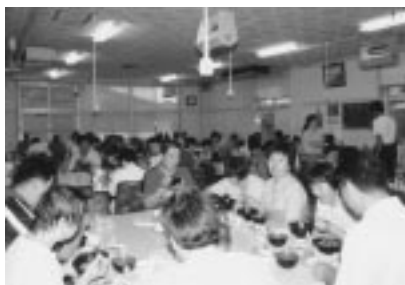
図 2 一斉給食の様子（整備前）